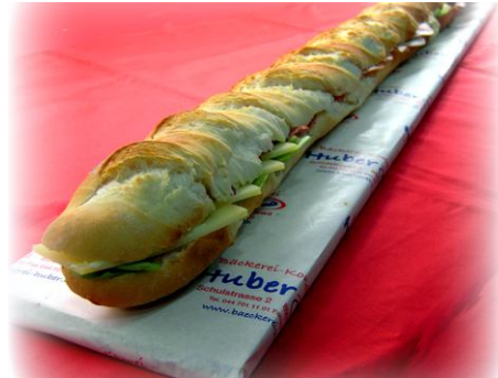
Baguette am Meter Baguette oder Hirtenbaguette assortiert gefüllt