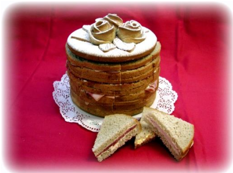
Pain Surprise „Gefüllte Brottorte“ mit Fleisch und Vegi-Füllungen