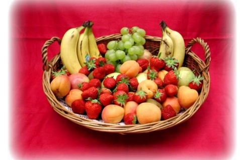
Früchtekorb Der leichte, fruchtige Renner...