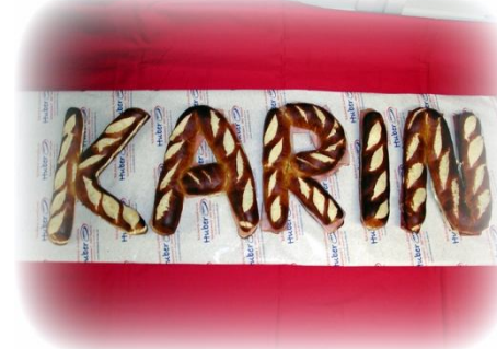
Gefüllter Schriftzug gefüllt Helles, dunkles oder Laugenbrot assortiert gefüllt