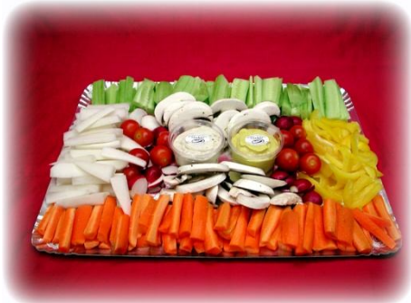
Gemüsedip Frisches Gemüse mit Dip-Saucen