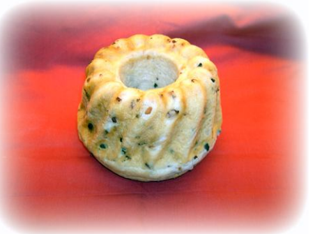
Speckgugelhopf Auch kalt ein wahrer Genuss