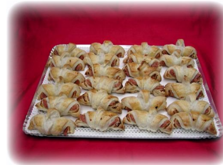
Schinken-Gipfeli Der klassiker beim Apéro