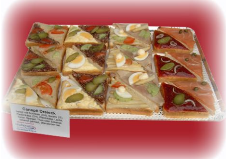
Canapée assortiert Canapée-Variationen in Dreieckform