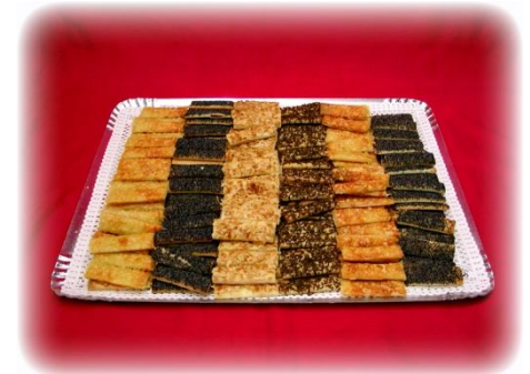
Apéro Gebäck-Stengeli Knuspergebäck mit Mohn, Sesam, Käse und Kümmi