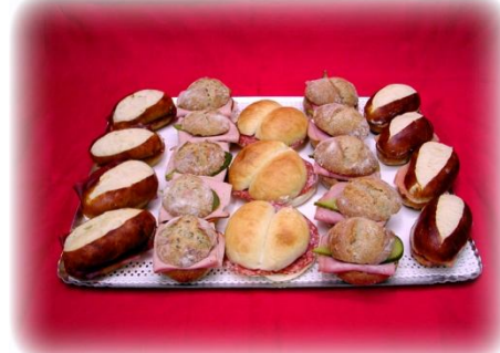
Mini-Sandwiches Gemischte Brötchen mit diversen Füllungen